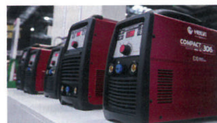
Helvi ha sede a Sandrigo (Vi) - helvi.com/it