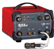
Optional BOX HF 99900127