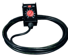
Optional REMOTE CONTROL 99810016 - 10 m 99810013 - 4 m