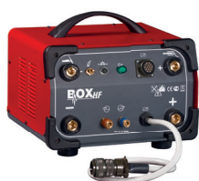
Optional BOX HF 99900127