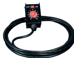
Optional REMOTE CONTROL 99810016 - 10 m 99810013 - 4 m