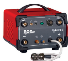
Optional BOX HF 99900127