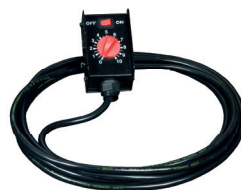
Optional REMOTE CONTROL 99810016 - 10 m 99810013 - 4 m