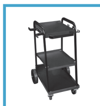
OPTIONAL TROLLEY 99900194