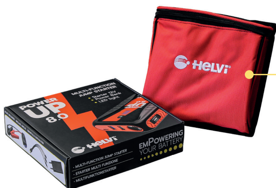
STRAPS ON THE BACK