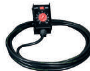
Optional REMOTE CONTROL