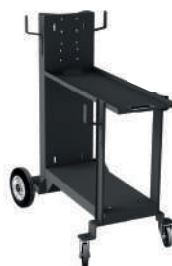
Optional TROLLEY 99900258