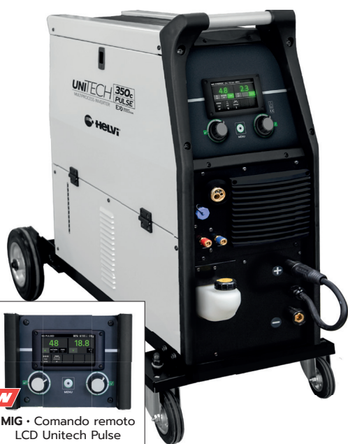
NEW MIG • Comando remoto LCD Unitech Pulse